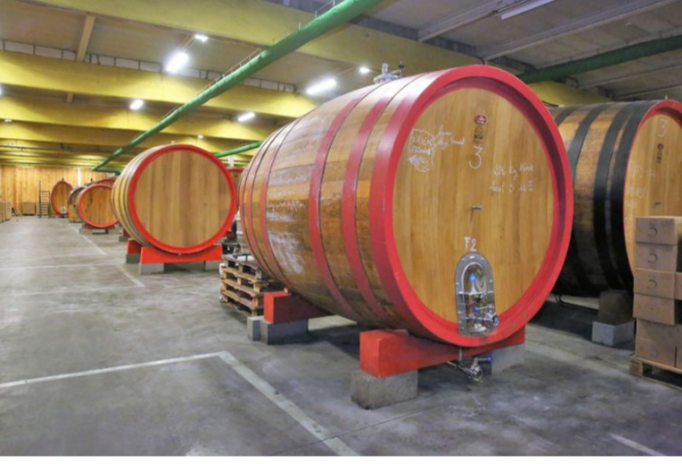
De tonnenzaal van 3 Fonteinen in Lot waar de geuze en kriek rust.