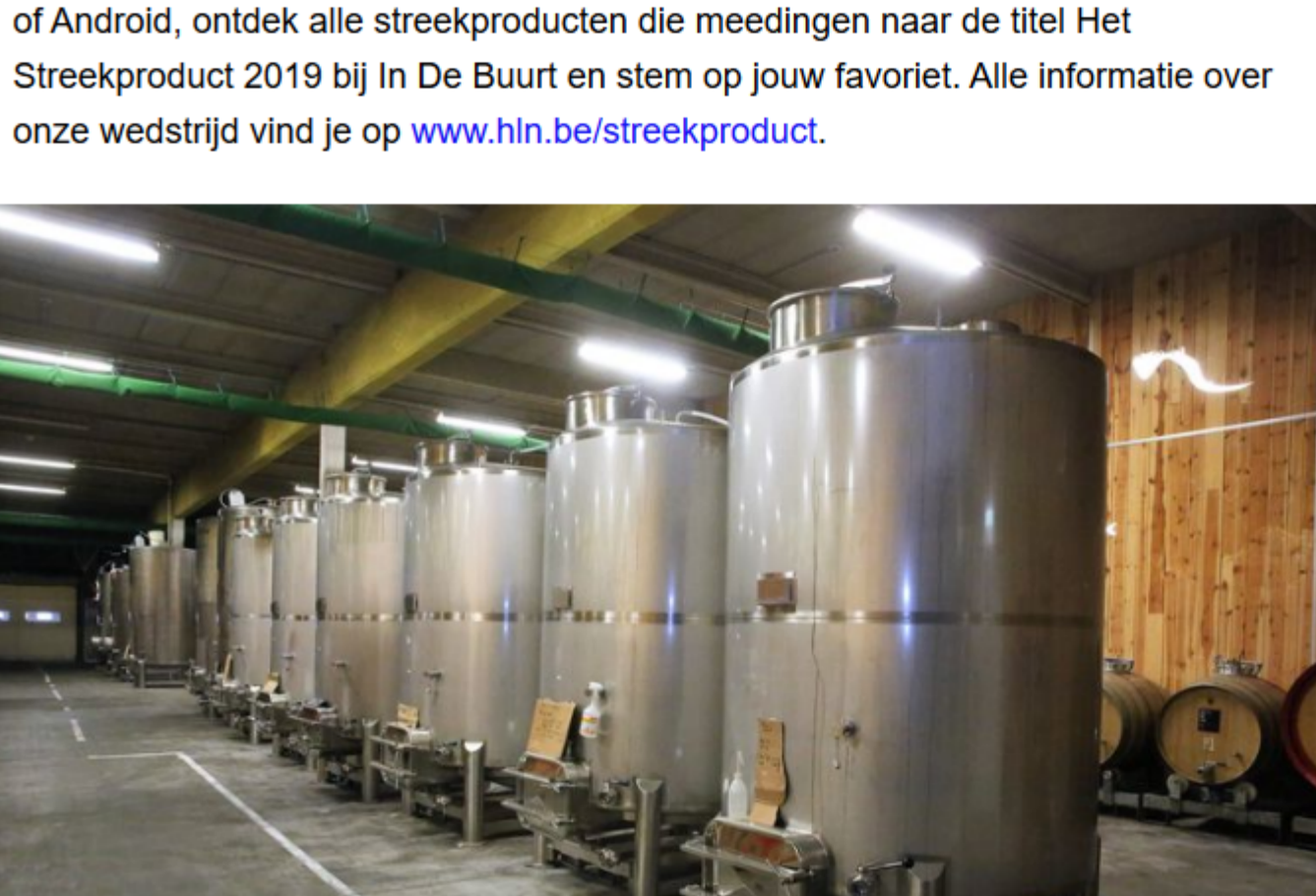
In deze tanks van 3 Fonteinen in de opslagplaats in Lot rust de kriek.

Het Laatste Nieuws gaat in samenwerking met Vlam op zoek naar het Beste Streekproduct van Vlaanderen. Een streekproduct wordt ambachtelijk vervaardigd, in de eigen streek, met een traditie van minimum 25 jaar en... geniet natuurlijk bekendheid bij het publiek. Stemmen op jouw favoriete streekproduct kan via de HLN app. Download gratis de nieuwe HLN-app op iOS of Android, ontdek alle streekproducten die meedingen naar de titel Het Streekproduct 2019 bij In De Buurt en stem op jouw favoriet. Alle informatie over onze wedstrijd vind je op www.hln.be/streekproduct .