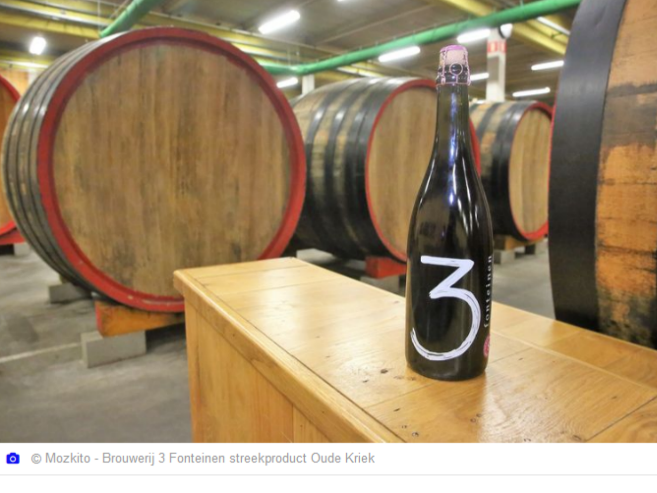
Brouwerij 3 Fonteinen streekproduct Oude Kriek

Een doordeweekse middag in de Lambik-O-droom in de Beerselse deelgemeente Lot. In de degustatieruimte van 3 Fonteinen proeven enkele toeristen de bieren van 3 Fonteinen. De voertaal is Engels, maar behalve Engelsen hebben die dag ook Zuid-Amerikanen een halte in Beersel aangestipt. "Bierliefhebbers uit de hele wereld kennen 3 Fonteinen", glundert salesverantwoordelijke Gaëtan Claes. "De mensen vinden vanzelf de weg naar hier. Ze willen weten hoe dat bier dat ze zo lekker vinden nu eigenlijk gemaakt wordt. 'Craft beer' is tegenwoordig een hippe naam in het wereldje, maar eigenlijk waren 3 Fonteinen en andere lambiekbrouwerijen in de buurt daar al veel langer mee bezig."