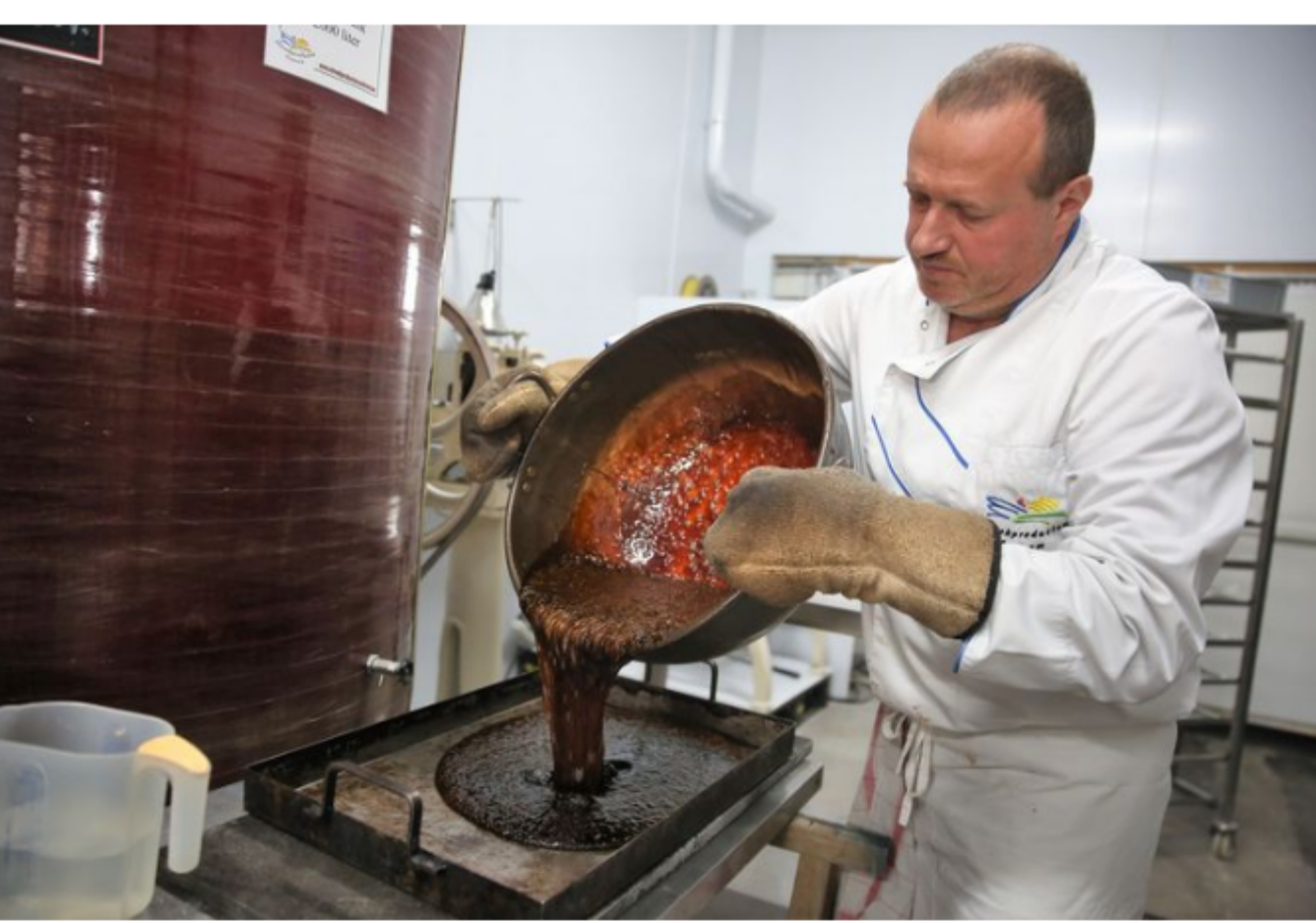
De mengeling wordt uitgegoten om af te koelen.