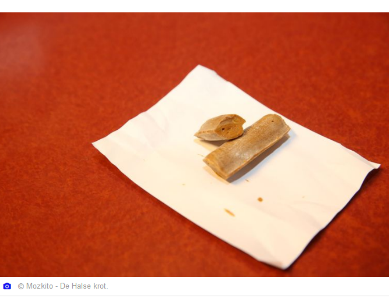
De Halse krot.